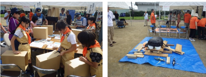
写真は、砺波市北部少年消防クラブが参加した砺波市防災士連絡協議会の段ボール椅子の制作と安城市NPOの地震なまぎジャッキアップ体験です。

うち、砺波市総合防災訓練では、事前に配布された非常持ち出し袋を市民が持参し、震度7の地震の想定のもと各機関共同で一斉訓練がおこなわれました。富山県防災士会は、砺波市防災士連絡協議会と、災害時相互応援協定を締結している愛知県安城市の市民団体とともに、防災啓発活動を実施しました。